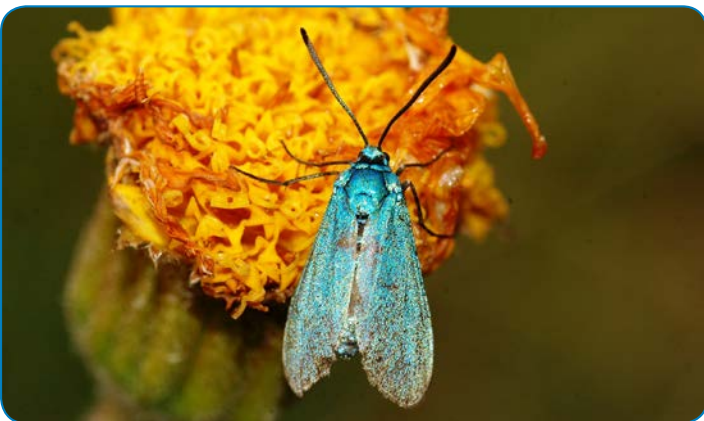
Metalvinge på guldblomme kan studeres i Rødme Svinehaver.