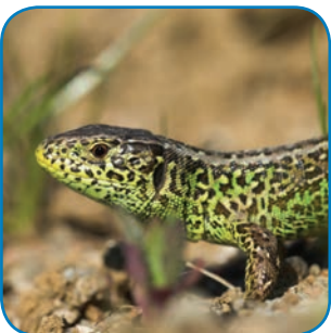
Markfirbenet lever på solrige sandede skrænter få steder i kommunen.