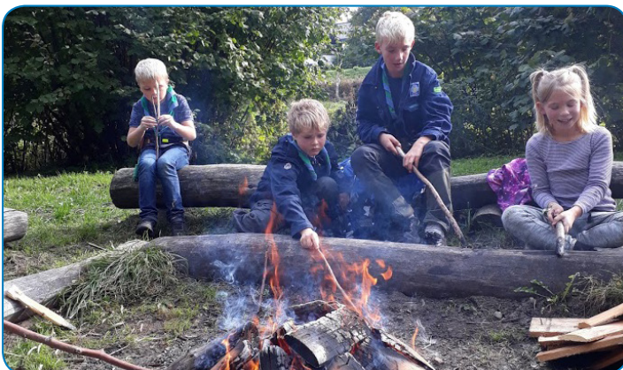
Christiansmindespejdernes minier laver mad over bål efter en lang gåtur i Vejstrup Ådal.