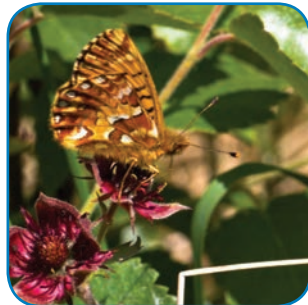
Moseperlemorsommerfugl er sjælden, men lever i Skovholm og Ravnebjerg moser.