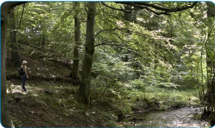
Fordybelse ved Vejstrup Å.