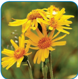
Guldblomme vokser i Rødme Svinehaver som det eneste sted i Østdanmark.