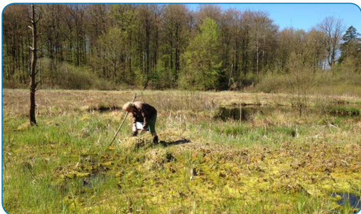
Skovholm Mose er en hængesæk, der er dannet af spagnummosser. Her lever flere af vores mest sjældne arter.