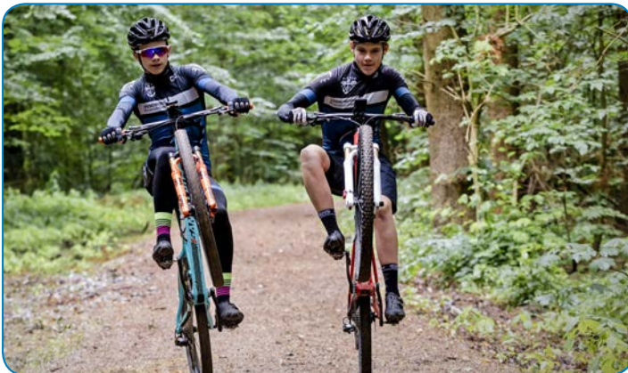
Venskaber opstår gennem et aktivt udliv.