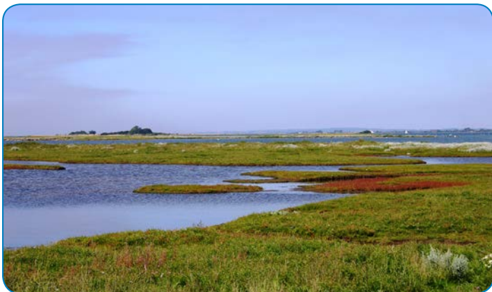
Det Sydfynske Øhav er et oversvømmet istidslandskab, hvor bakkerne når op over vandet og bliver til øer og holme.