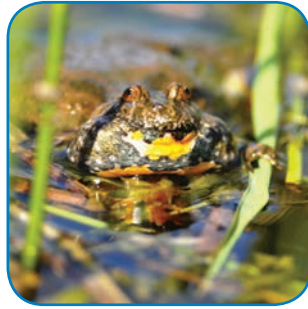
Klokkefrøen findes på Østfyn og øerne i Øhavet. Dens kvækken lyder, som når man blæser i en hul flaske.