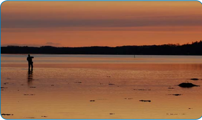
Lystfisker i solnedgangen.