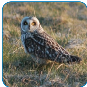
Mosehornuglen både yngler og overvintrer på øerne i Øhavet.