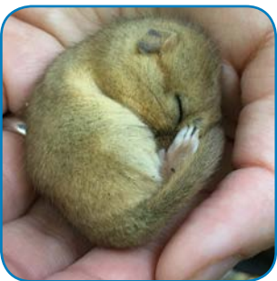
Hasselmusen ruller sig helt sammen, når den sover vintersøvn.