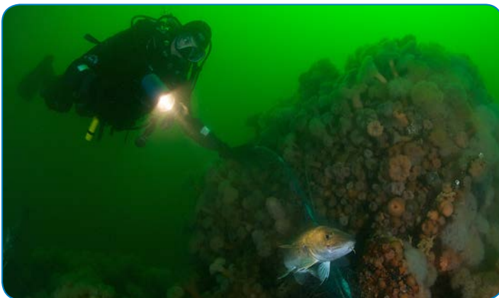
Dykker ved vrug.