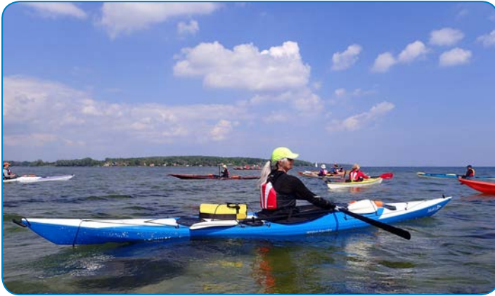
Sejlads i havkajak giver motion, naturoplevelser og fællesskab.