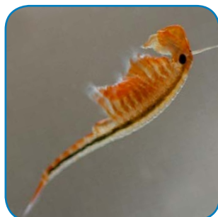
Forårsfereje er en urgammel art. Den bliver 2-3 cm lang.