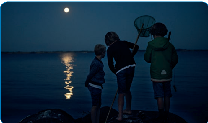
En sommernat i måneskin ved Elsehoved.