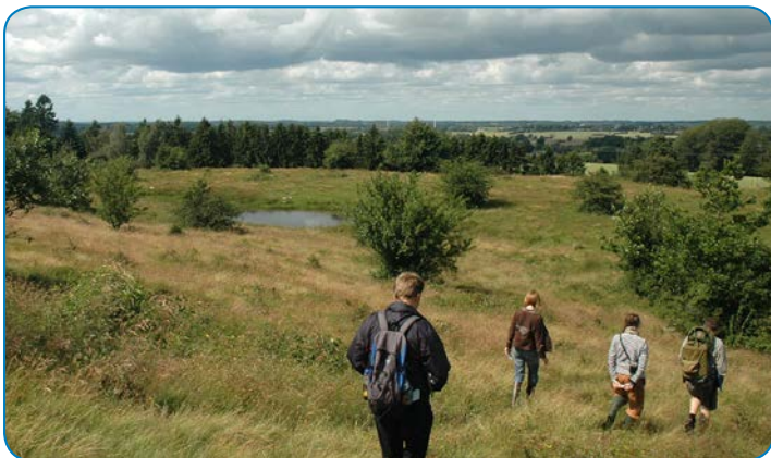
Rødme Svinehaver har aldrig været opdyrket. Græsning gennem flere hundrede år har skabt det artsrige overdrev.