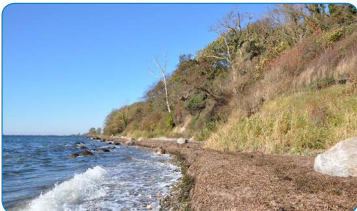
Præstens Skov ved Ballen er en stævningskov. Skoven er også præget af sin nærhed til kysten med store vedbend.