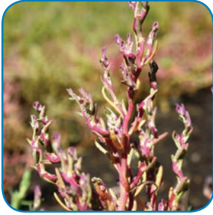
Tangurt farver strandengene røde om efteråret. Den kan kendes på de snoede stængler.