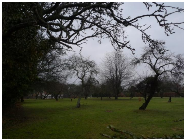
Bebyggelsen ligger hævet på den lave kystskrænt (tv). Store og små abildgårde ses overalt i byen (th).