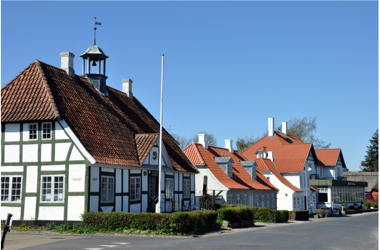
"Centrum" i Troense med skolen og hotellet i baggrunden.