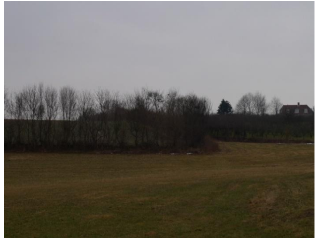
Nedkørsel til Troense fra Eskær (tv). Morænebakken rejser sig vest for byen (th).