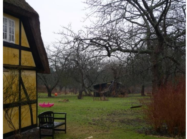
Række af Bedre Byggeskik på Badstuen (tv). Æbletræer bag hus på Grønnegade (th).