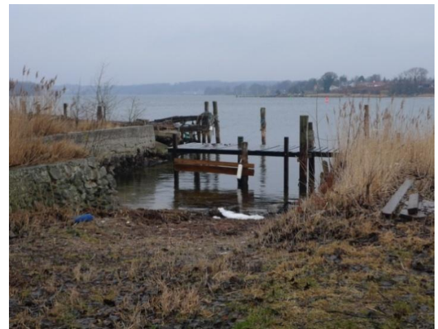
Værftsbygning på Jacobsens Plads (tv). Skibsbro og bedding trænger til istandsættelse (th).