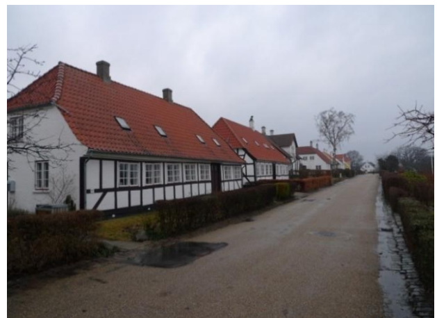
Bymiljø i Grønnegade (tv). Bebyggelsen på Troense Strandvej (tv).