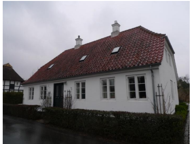
Fuldmurede huse i endnu ikke fuldt udviklet klassicistisk stil. Den taktfaste facaderytme og kraftige opskalkning er karakteristiske - men hoveddøren sidder ikke i midten, som den burde.