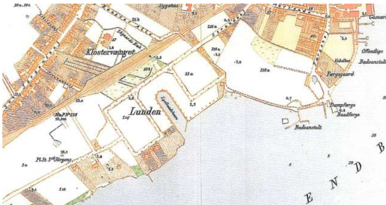
Bykort fra 1903. Vejene i Lunden er allerede anlagt - men kun få villaer opført.