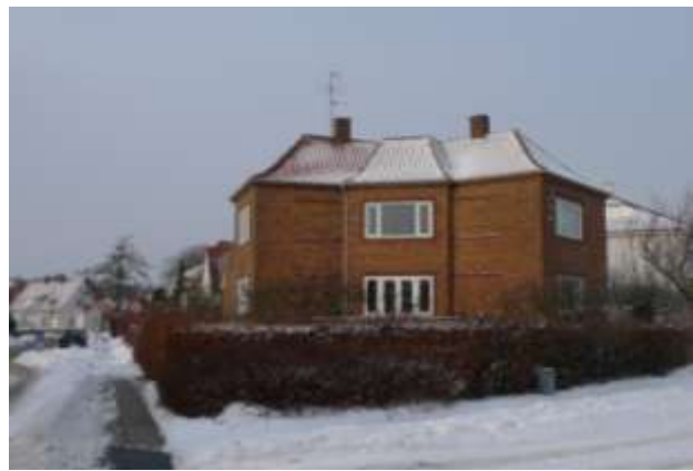
Bygninger med dominerende beliggenhed i sigtelinier, typisk i sving eller ved vejkryds. Villaen til venstre fra 1935 markerer sig primært med sit enkle, klare volumen, mens bygningen til højre, opført bare 1 år senere i 1936, tydeligt forholder sig til placeringen i krydset mellem Niels Ruedsvej og Herluf Trollesvej.