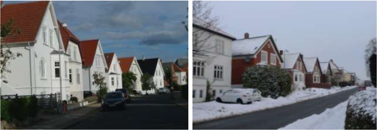
Kurvet forløb på Herluf Trollesvej i Willemoeskvarteret (tv.) og retlinet forløb på Strandvej i Lunden (th.)