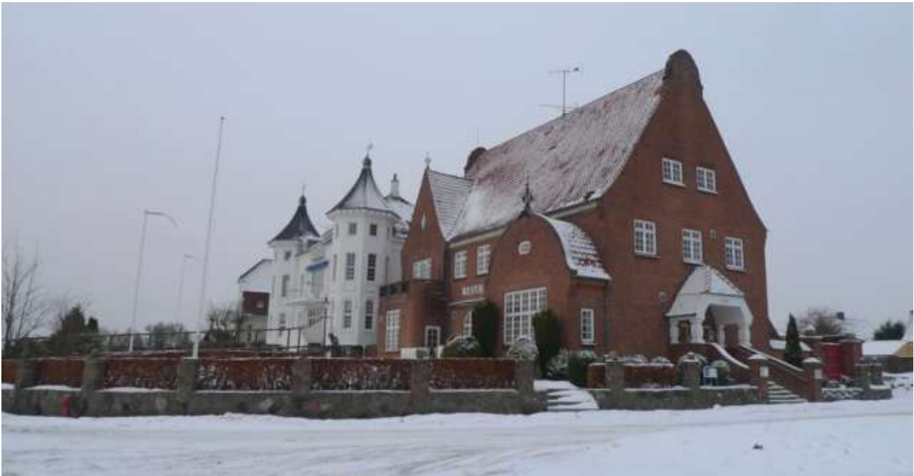
De to dominerende villaer vender ud mod lystbådehavnen. Særligt rødstensvillaen fra 1916 i skønvirkestil er et studie i finurlige detaljer.