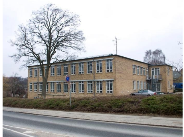
Musikskolens indgangsparti (tv) og vestlige facade (th).