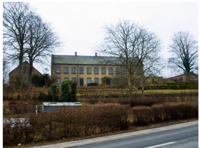
Til venstre ses Viebæltegårds hovedbygning og et af de karakteristiske enkeltstående træer. Til højre ses den nordlige fløj og den terraserede have.