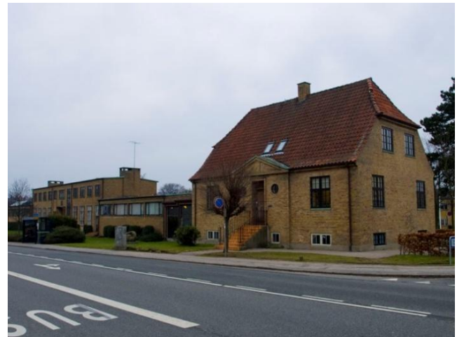
Bibliotekets bygninger set fra Viebæltet (tv) og bagsiden af nabovillaen, hvis have er omdannet til parkeringsplads (th).