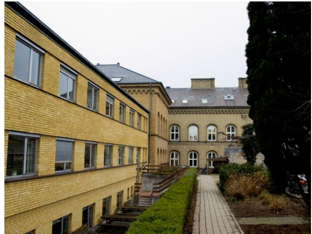
Hovedbygningen ved Svendborg Industriforenings Tekniske Skole fra 1882 (tv) samt tilbygningen fra 1976 (th). I midten af billedet til højre anes også tilbygningen fra 1935.