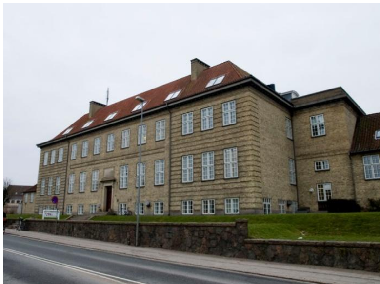
VUC, det tidligere statsgymnasium, er opført i en stram klassicistisk stil.

Betragtes bygningskomplekset fra Viebæltet fremstår det intakt og som en helhed. Ses det fra Dronningemaen er indtrykket et helt andet. Dette skyldes, at der i 2004 blev der opført en større tilbygning til VUC. Tilbygningen er placeret vinkelret på hovedbygningen og står i stor kontrast til den massive gulstensbygning. Mod syd er facaden domineret af et stort glasparti og en søjlerække, der holder et stort tagudhæng. Mod syd og øst har tilbygningen sorte, træbeklædte facader og hvide vinduesrammer. Mod øst er der i næsten hele bygningens længe en svalegang i beton og glas.