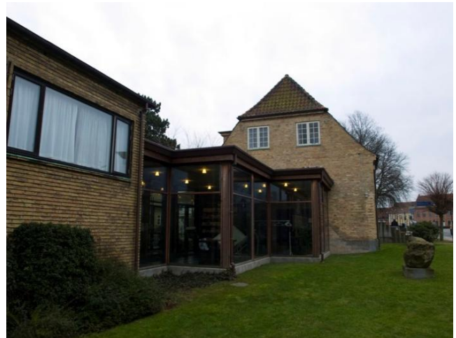
Bibliotekets hovedbygning (tv) og den lave mellembygning, der forbinder hovedbygningen med nabovillaen.