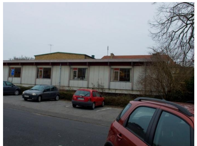
Bibliotekets bagside skæmmes af en simpel tilbygning fra 70'erne, der er opført uden hensyntagen til de omkringliggende bygningers arkitektur.